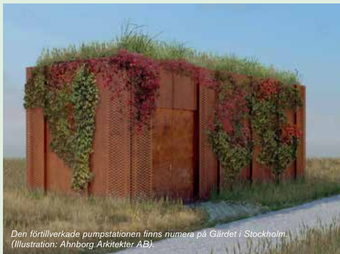
Den förtillverkade pumpstationen finns numera på Gärdet i Stockholm. (Illustration: Ahnberg Arkitekter AB).

FVB har projekterat en pumpstation för fjärrkyla åt Stockholm Exergi speciellt anpassad till förtillverkning. Pumpstationen färdigställdes på en verkstad i Uppsala, vilket inkluderade pump, rörledningar och fasad innan den transporterades till Gärdet i Stockholm. Konceptet med förtillverkade pumpstationer ger kostnadseffektivt montage och kort projekttid på den slutgiltiga placeringen.