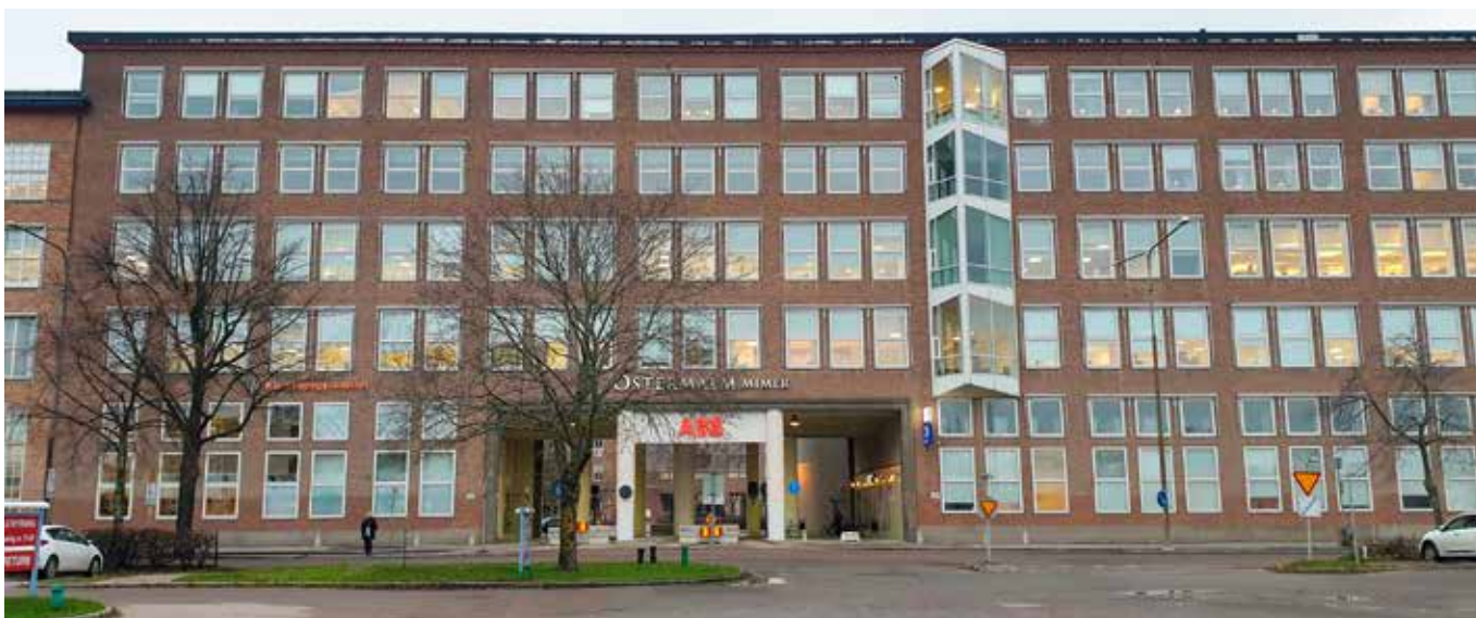
Den första fjärrkylakunden var ABBs gamla industrivarter – Mimer – i Västerås, vilket byggdes om till kontor. Så här ser byggnaden ut idag.