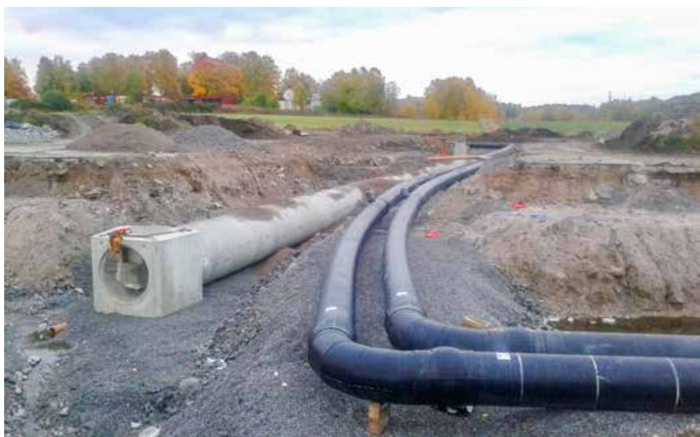
En tidig etapp visar hur flera olika rör och ledningar ska samsas i marken.

Ytterligare information: Oskar Österberg, 08-5947 61 66