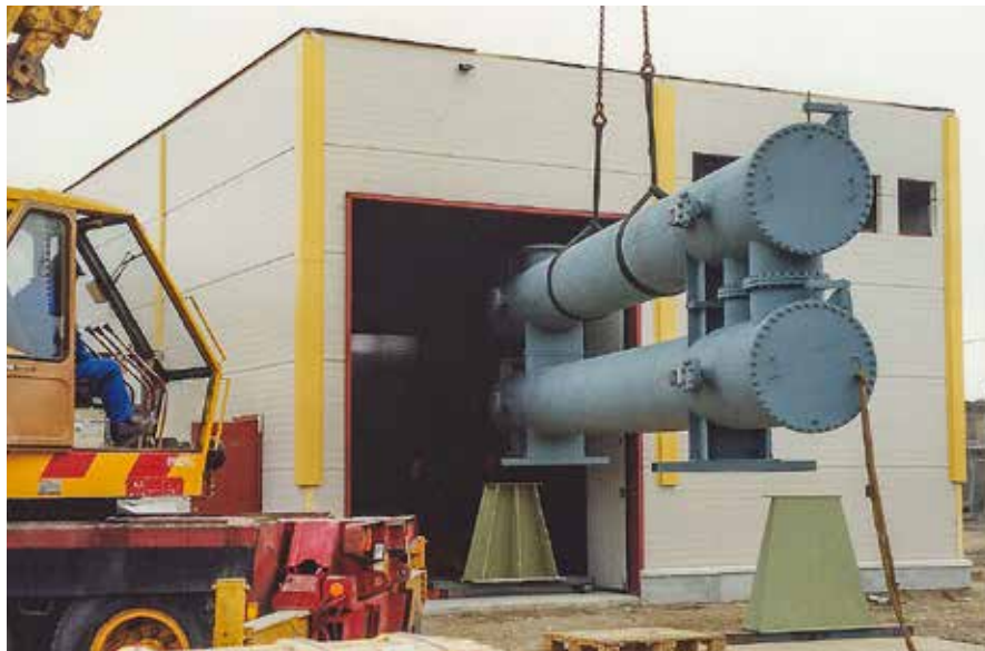
Här lyfts tubvärmväxlare in i kylproduktionsanläggningen.

Sveriges första fjärrkylanläggning togs i drift i Västerås 1992. Detta tack vare att FVB-medarbetaren Anders Rydåker tog med sig tekniken från USA. Idag finns fjärrkyla i 40 städer i Sverige och expanderar nu rejält.