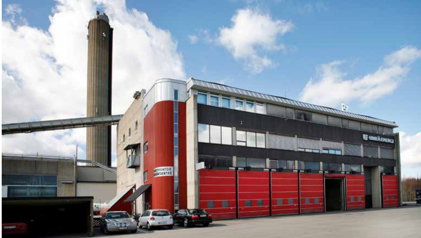
Under 2021 kommer Umeå Energi att bygga om och förstärka de kritiska delarna på Ålidhems värmeverk.