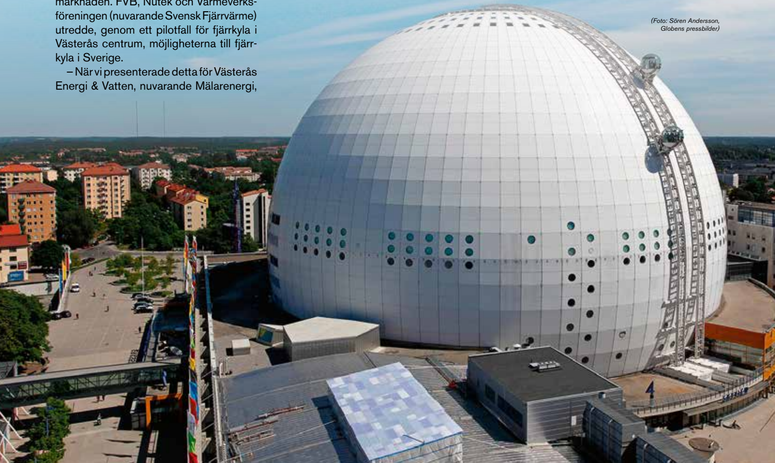
Globen är en av de många arenor i Stockholm som kyla med fjärrkyla.