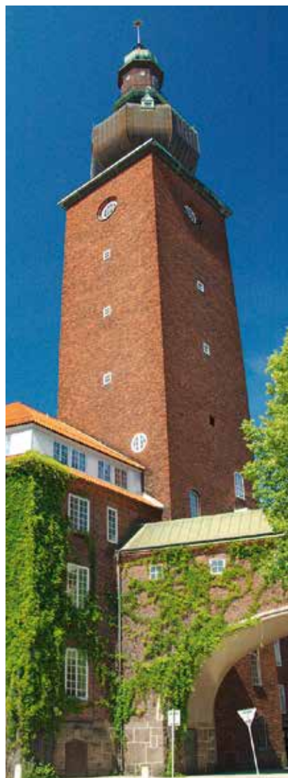
ABB Sveriges dåvarande huvudkontor Ottar, var 1992 en av landets första fjärrkylekunder.

– För kunderna innebär fjärrkyla flera fördelar. Prismässigt ligger det på ungefär samma nivå som egen produktion, men med fjärrkyla får de en säkrare och miljövänligare produktion än egna kylmaskiner. De slipper egen utrustning som ska skötas, de slipper ha plats för fläktar på taket och de har stora möjligheter att variera hur mycket